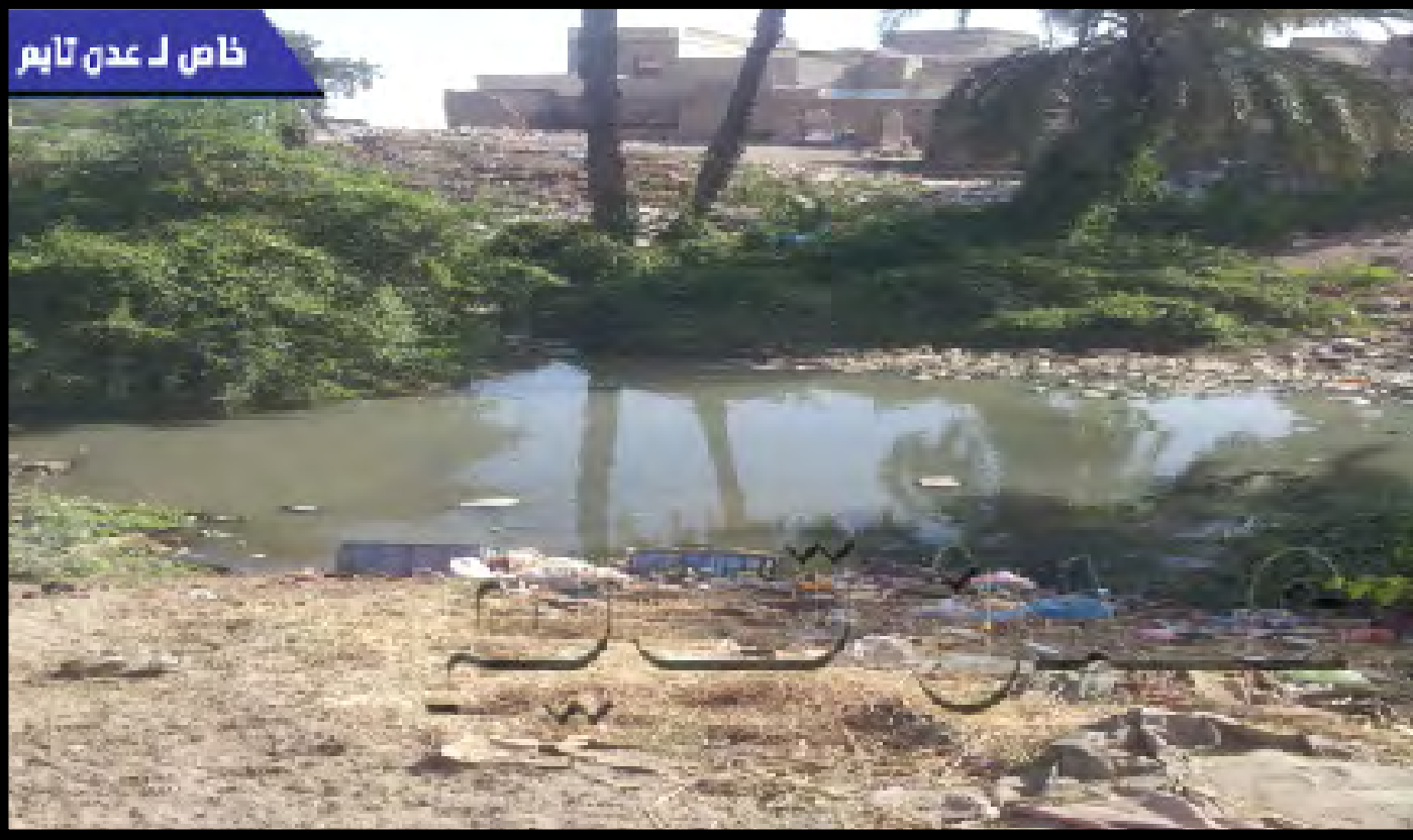
خاص لـ عدن تايم

قرية عبر لسلم واحدة من قرى مديرية تبين لحج تقع من الجهة الغربية لمدينة الحوطة وتبعد عنها حوالي كيلو ونصف، تعتبر قرية عبر لسلم من أكبر القرى في تبين خاصة من حيث الكثافة السكانية ومساحتها الجغرافية حيث تغطي في القرية أكثر من ٩٥٠ أسرة، الغالبية من أبنائها عاطلون عن العمل والبعض منهم يعمل في مجال الزراعة فحال هذه القرية لا يختلف عن حال القرى المجاورة التي تعاني نفس المشاكل الخدمية والإنسانية.